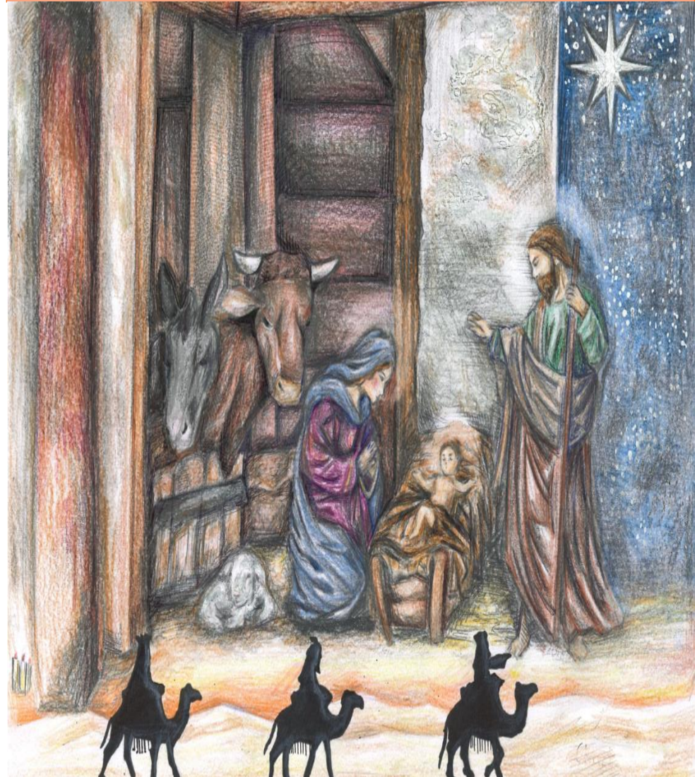
Primer premio curso 2017-18